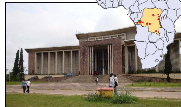
Le bâtiment principal de l'Université de Kinshasa