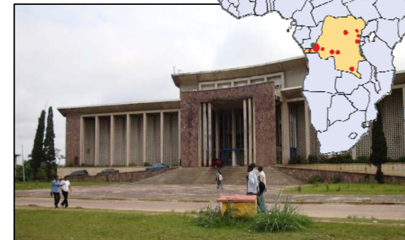
Le bâtiment principal de l'Université de Kinshasa